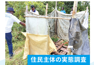
住民主体の実態調査