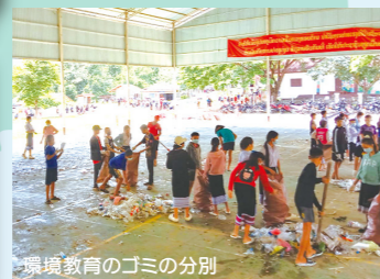
環境教育のゴミの分別

2018年からはルアンパバーン県内の小中学校を対象に環境教育に取り組んでいます。ルアンパバーン県は自然がとても豊かなため、今後エコツーリズム産業が発展していくと期待されています。また、高速鉄道や高速道路の整備に伴い物流も活性化していく中で、ゴミ処理や環境に配慮した農業の大切さを次世代に伝えていくことがとても大切です。