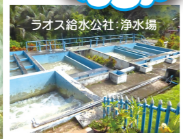
ラオス給水公社・浄水場

ラオスでの事業は、2010年に国連ハビタットのメコン川流域の給水・衛生設備建設プロジェクトを支援したことから始まりました。ラオスが発展していくのに伴い、水の需要はますます増えることが想定されたため、給水設備建設だけでなく、そもそもの源泉を守っていくことがとても重要でした。そこで、2012年からラオス給水公社ルアンパバーン事務所と協力して植林活動を開始しました。