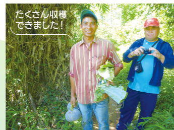
たくさん収穫できました！

水土保全に役立つ樹木だけでなく人々の暮らしに役立つ果樹も植林しました。また、取り木といった果樹増殖技術や種からの苗木育成指導なども行うことで、住民達の意識が変わり、植林が行われました。水源が守られるだけでなく、人々は野菜や稲作などを安定して行えるようになり、さらに果樹増殖技術により果樹をどんどん増やしたことで、収入が向上し暮らしが良くなっていきました。