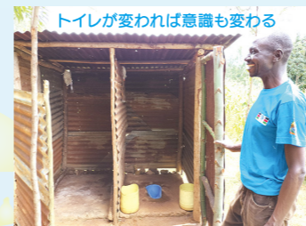
トイレが変われば意識も変わる