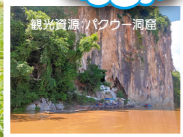
観光資源・バクワー洞窟

2018年からはルアンパバーン県内の小中学校を対象に環境教育に取り組んでいます。ルアンパバーン県は自然がとても豊かなため、今後エコツーリズム産業が発展していくと期待されています。また、高速鉄道や高速道路の整備に伴い物流も活性化していく中で、ゴミ処理や環境に配慮した農業の大切さを次世代に伝えていくことがとても大切です。