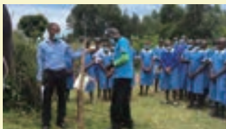
手洗いの啓発活動