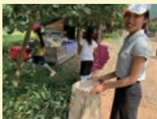
地域でのゴミ拾い活動