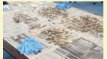
[上] 企業でのワークショップ [下] 社員の方が一生懸命仕分けして下さいました

当協会はこれまで市民と企業の皆さまに支えられながら活動してきました。企業の皆さまには、助成金や寄付金等のご支援だけでなく、外貨コイン仕分けなどのボランティア活動にも、積水化学工業(株)、(株)ジェーシービー、三菱商事(株)、三井物産(株)、シトリックス・システムズ・ジャパン(株)、(株)電通、日本郵船(株)等の社員の方々にご参加いただき、空港等に設置してある募金箱に寄せられる外貨などの寄付を支援活動に役立てていただきました。