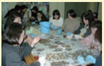
[上] 2005年のボランティアデー [下] 2019年のボランティアデー

また、各空港の募金箱設置にご協力いただいております。成田国際空港(株)、東京国際ターミナル(株)、北海道エアポート(株)、中部国際空港(株)、関西エアポート(株)、福岡国際空港(株)、博多港開発・西部ガス共同事業体、長崎空港ビルディング(株)、熊本空港ビルディング(株)、那覇空港ビルディング(株)に心より感謝申し上げます。