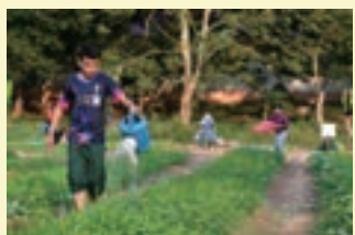
環境に配慮した有機野菜の栽培